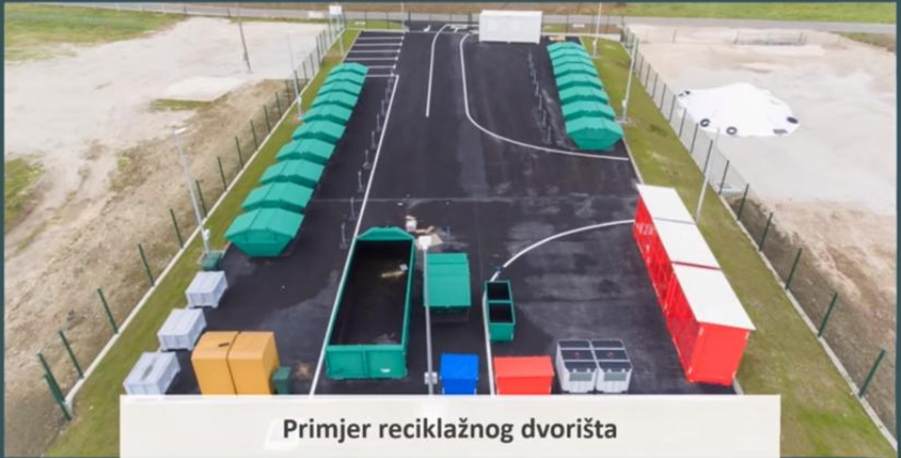
Primjer reciklažnog dvorišta